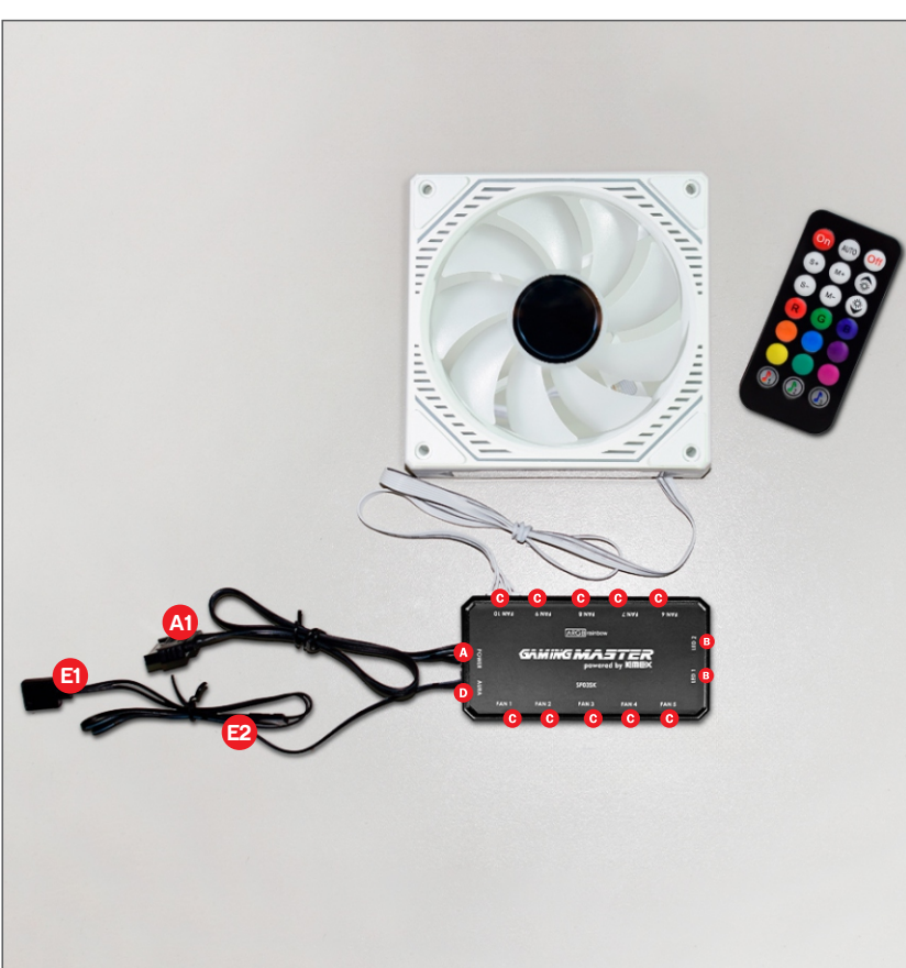
DIAGRAMA DE CONEXÕES