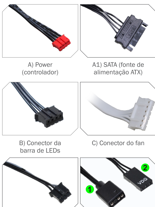
A) Power (controlador)