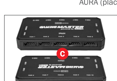
CAPACIDADE PARA 10 FANS