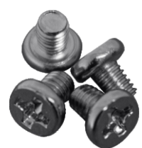
PARAFUSOS DE FIXAÇÃO (BOMBA)