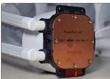
PLACA DE BASE DE COBRE (MAIOR CONDUTIVIDADE TÉRMICA)