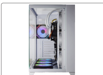
RADIADOR FIXADO EM GABINETE