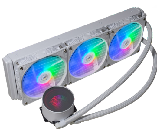
VISTA TRASEIRA (RADIADOR)