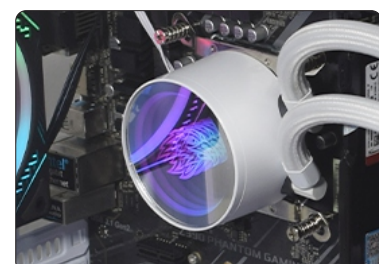
BOMBA FIXADA EM PLACA-MÃE