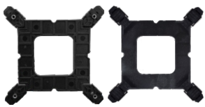
01 BASE RETANGULAR