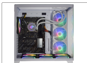
WATER COOLER INSTALADO