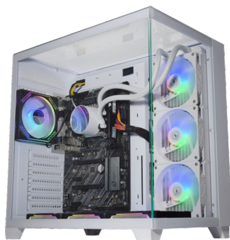
WATER COOLER INSTALADO NO GABINETE