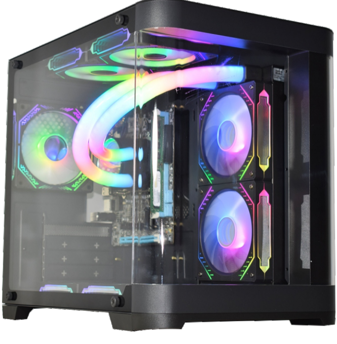
WATER COOLER INSTALADO NO GABINETE