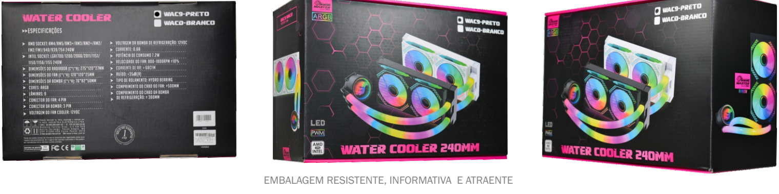
EMBALAGEM RESISTENTE, INFORMATIVA E ATRAENTE

ATENÇÃO: AS FOTOS ACIMA SÃO APENAS ILUSTRATIVAS E ALGUNS ITENS EXIBIDOS SÃO VENDIDOS SEPARADAMENTE. CONSULTE Nossos VENDEDORES PARA MAIS INFORMAÇÕES SOBRE O PRODUTO E SUAS RESPECTIVAS PEÇAS.