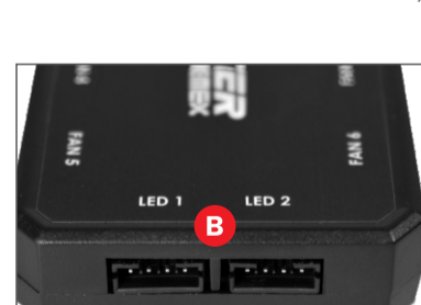
CAPACIDADE PARA 2 BARRAS DE LED (NÃO INCLUSAS)