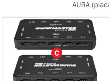
CAPACIDADE PARA 10 FANS