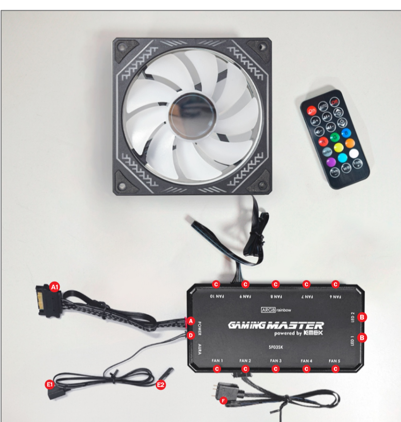
DIAGRAMA DE CONEXÕES