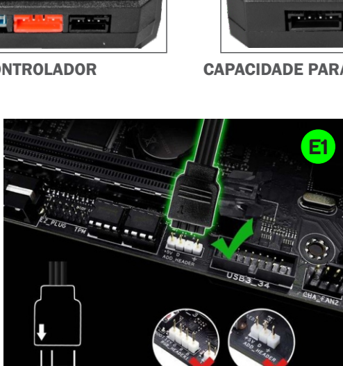
Apenas para 3P SV ADD_HEADER +SV, DATA, N/A, GND