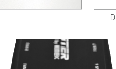
CAPACIDADE PARA 2 BARRAS DE LED