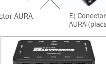
CAPACIDADE PARA 10 FANS