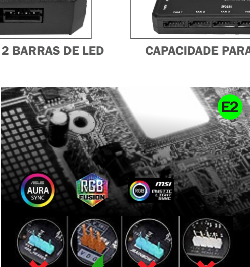
Para SV 3P HEADER