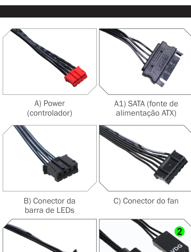
A) Power (controlador)