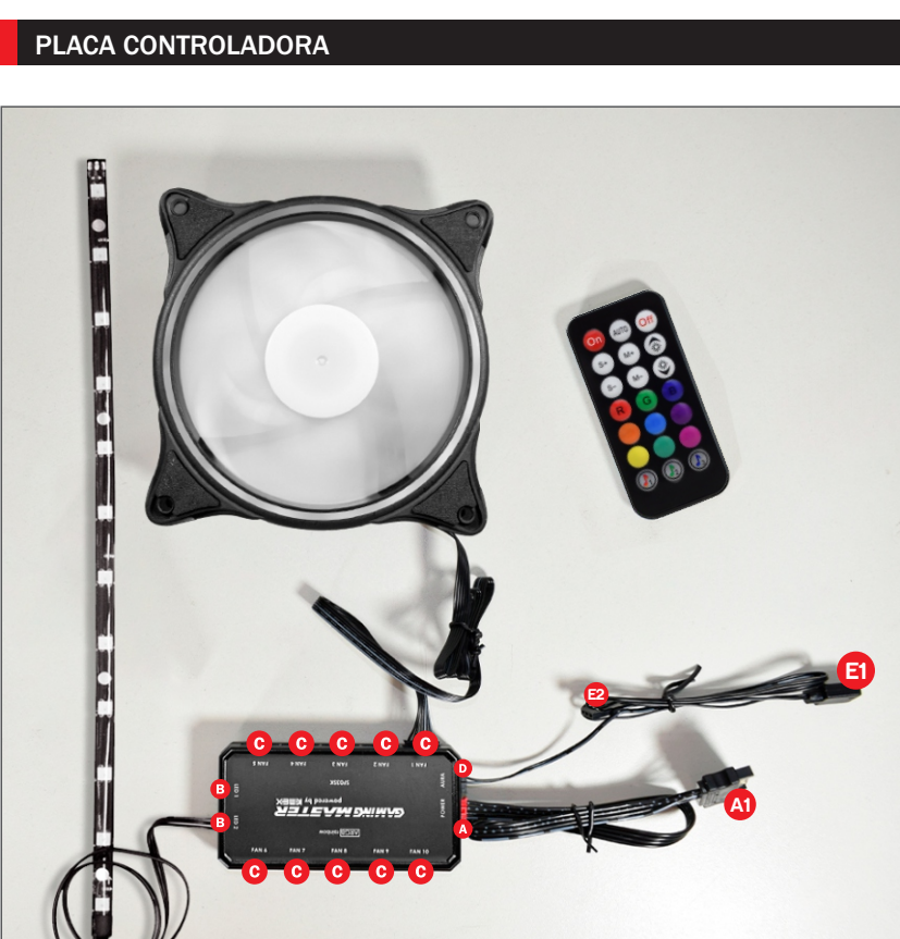
DIAGRAMA DE CONEXÕES