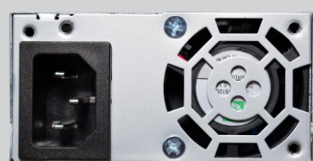
Ventilação de 40x40mm