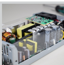
Filtro de entrada