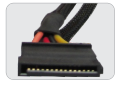
04 CONECTORES SATA