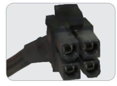
02 CONECTORES P4 12+12V