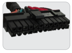
01 CONECTOR PARA PLACA MÃE ATX 20+4P