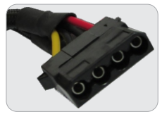
02 CONECTORES IDE