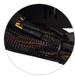
MALHA DE PROTEÇÃO DOS CABOS