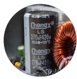
CAPACITOR ELETROLÍTICO (FILTRO DE ENTRADA)