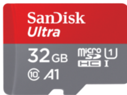
SanDisk Ultra microSD with SD Adapter