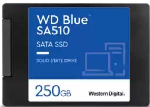
SSD WD Blue SA510 SATA 2,5"/7 mm encapsulado