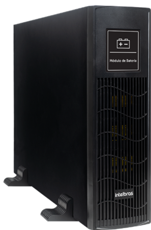
MB 1607 192V RT Módulo de baterias externas 192 V (16 x 7 Ah)