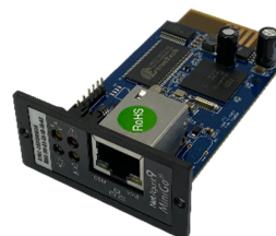
PGR 801L Placa SNMP para gerenciamento remoto