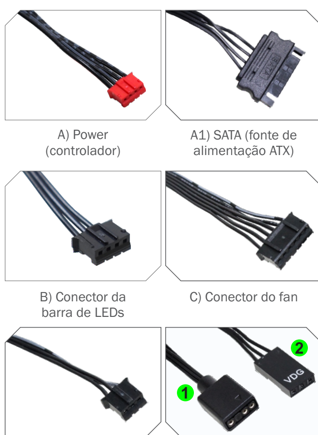
A) Power (controlador)