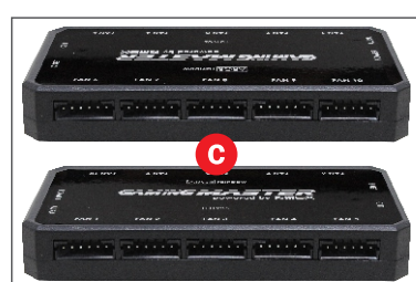
CAPACIDADE PARA 10 FANS