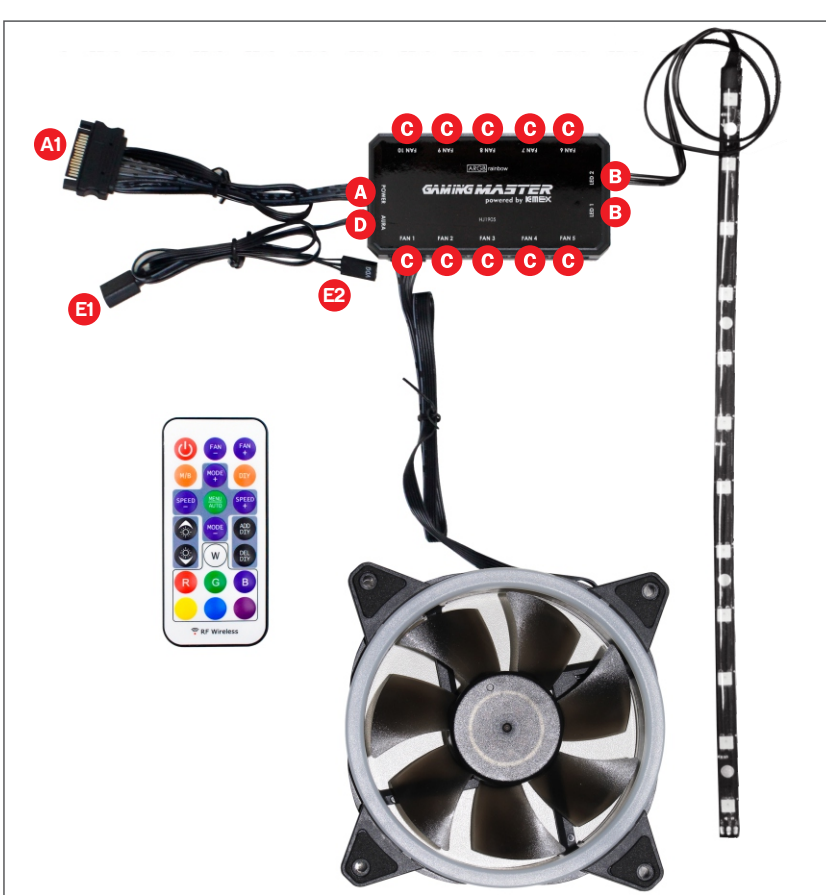
DIAGRAMA DE CONEXÕES