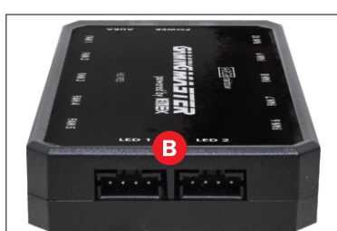
CAPACIDADE PARA 2 BARRAS DE LED