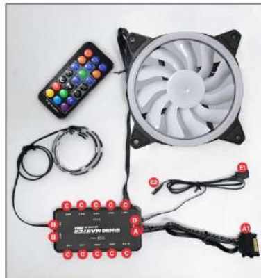
DIAGRAMA DE CONEXÕES