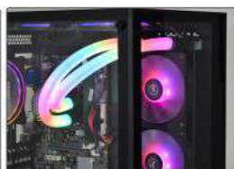
WATER COOLER INSTALADO