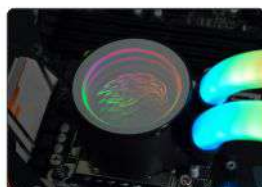
BOMBA FIXADA EM PLACA-MÃE