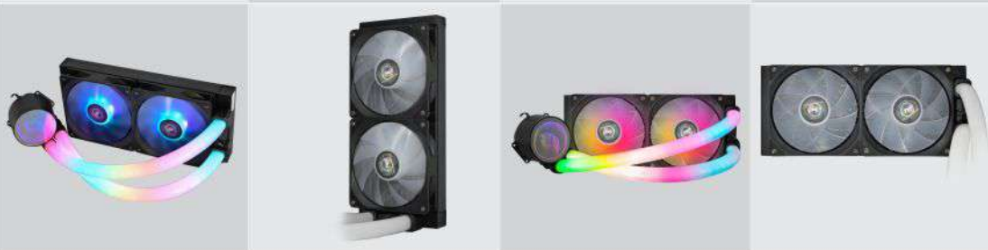
VISTA TRASEIRA (RADIADOR)