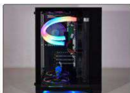
RADIADOR FIXADO EM GABINETE