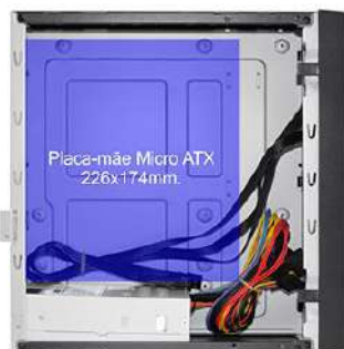
Vista interna do gabinete (sem o suporte). Fonte de alimentação instalada na horizontal para fixação de placa-mãe Micro ATX 226x174mm.