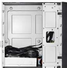
Vista interna do gabinete, com o suporte.