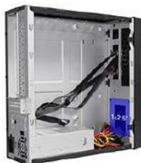
Vista interna do gabinete.