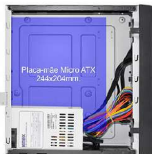
Vista interna do gabinete (sem o suporte). Fonte de alimentação instalada na vertical para fixação de placa-mãe Micro ATX 244x204mm.