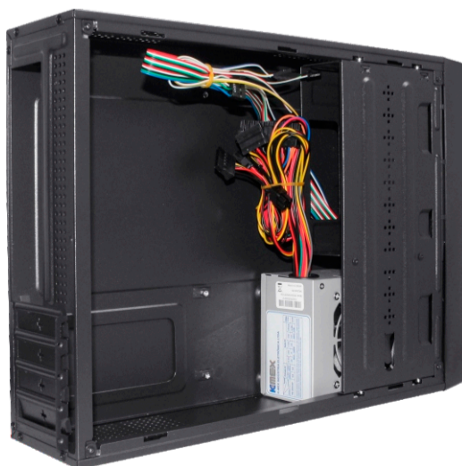
Chassi do gabinete disponível na cor preta.

Todos os nomes e logotipos são de propriedade de seus respectivos proprietários. As imagens contidas neste informativo são apenas ilustrativas.