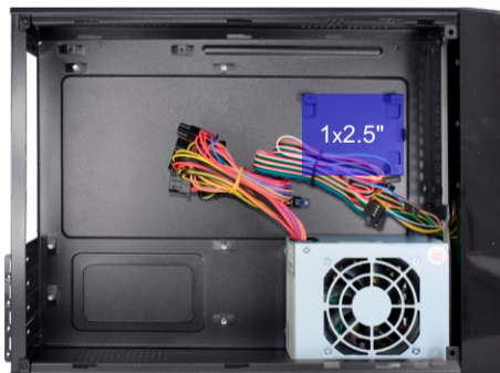
Vista interna do gabinete, sem o suporte.