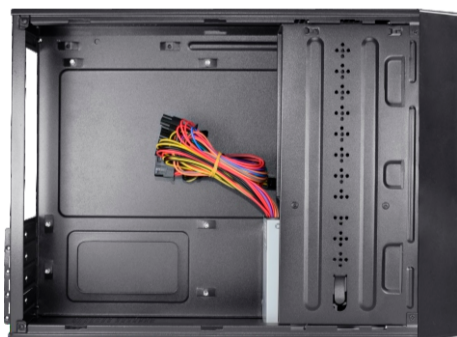
Vista interna do gabinete, com o suporte.