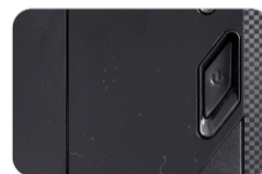
Painel black piano, com textura na lateral.