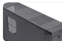
Vista superior do gabinete.