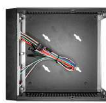
Vista interna do gabinete