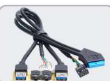
Opcional: Módulo I/O c/2* USB 3.0 + HD ÁUDIO