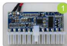
1 CN24. Conector 24P padrão ATX