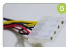
5 Conector 4P