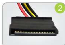
2 01 conector SATA