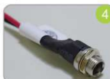
4 Conector de entrada para adaptador DC 12V