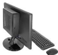
Gabinete fixado em monitor