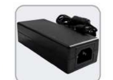
Adaptador externo Plug 5.5x2.5mm