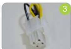
3 01 conector P4 12+12V