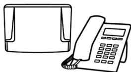
Central Telefônica e Telefone