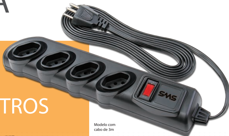
Modelo com cabo de 3m